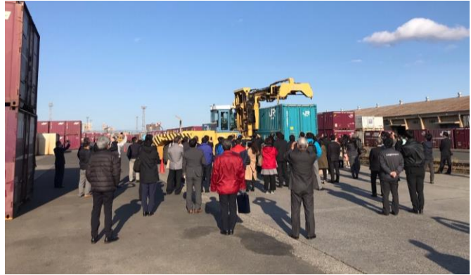
2020年度 鉄道コンテナ見学会の様子(仙台貨物ターミナル駅)