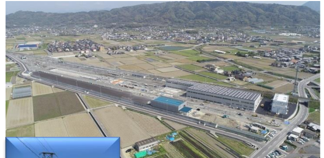
新松山貨物駅全景