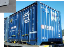
Rail & Seaコンテナ