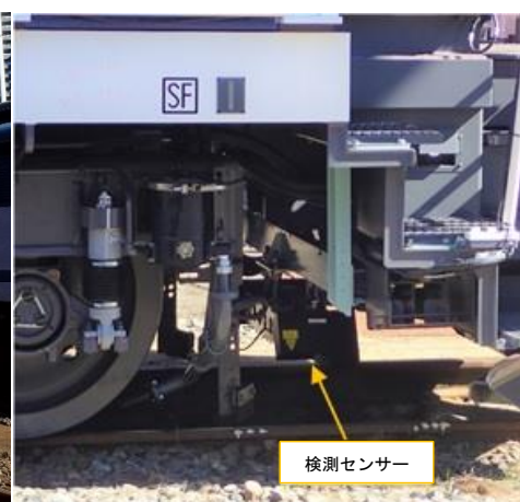
写真-2 検測センサー取付状況