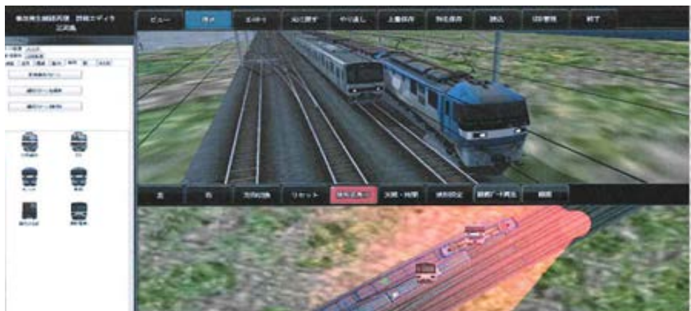
(写真4) 再現した三河島事故事例