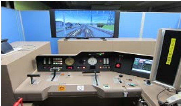
(写真1) 先行導入した東海支社シミュレータ1