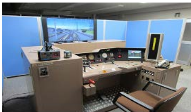
(写真2) 先行導入した東海支社シミュレータ2