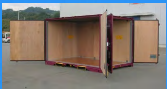
12フィートコンテナ (容積 18m³)