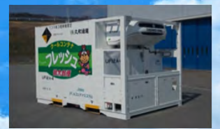
12フィートリーファーコンテナ 【温度設定：-25℃～+25℃】