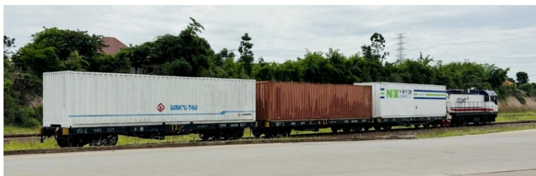
タナレーンドライポート駅（ラオス）到着の様子