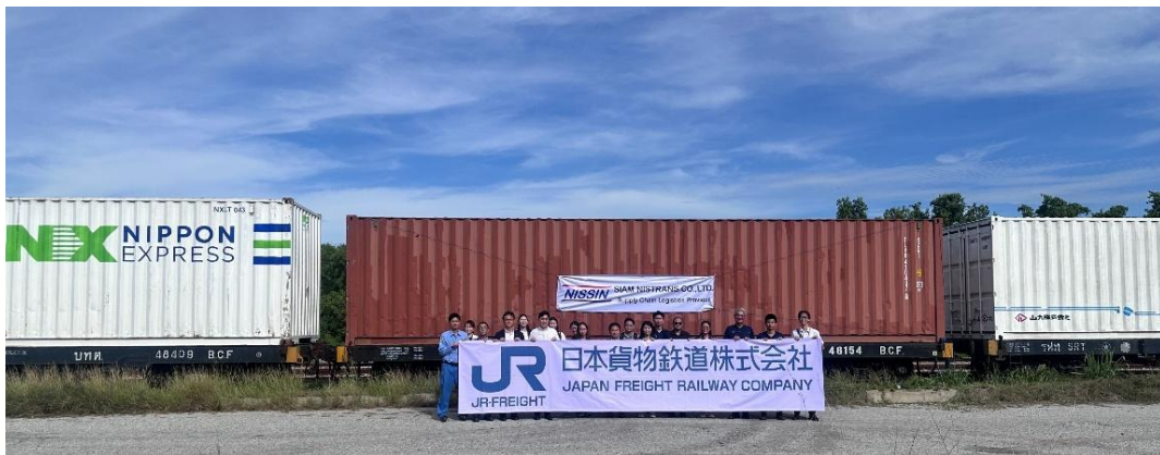
チョンブリ駅（タイ）発車前の様子