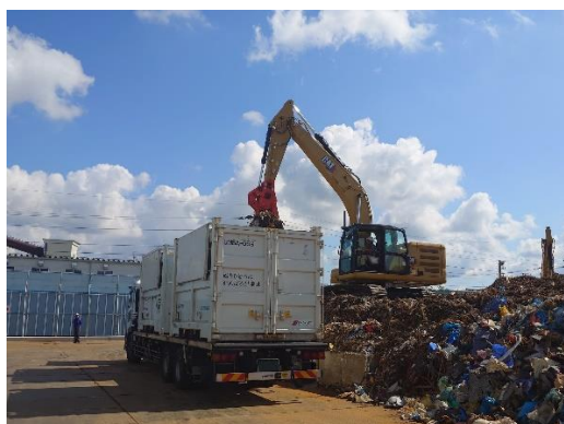
（災害廃棄物のコンテナへの積み込み）