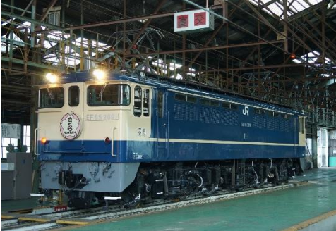
写真 1、EL 整備場 3 番線撮影イメージ