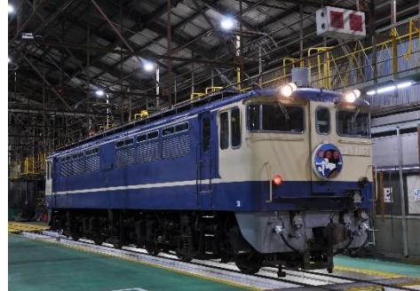
写真 2、EL 整備場 2 番線撮影イメージ

2024 年 大宮車両所は、日本鉄道株式会社時代の操業開始より 130 周年を迎えたことを記念し、各種イベントを実施してきました。今回は、ファンの皆さまのご要望にお応えし、「往年の客車列車を牽引した国鉄特急色」を建屋内で見学・撮影することに特化したイベントです。また、お一人様 10 分間は運転台見学・ご自身が選んだ列車愛称板（ヘッドマーク）を選んで取付けや交換風景が撮影できる等、自由な個人タイムを設定します。個人タイム内もご参加されるお客様は一緒に撮影・見学いただけます。