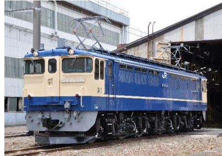
写真 2、国鉄特急色イメージ

※1 写真 1 のイメージ写真内左から DC 線、EL3 番線、EL2 番線となります。