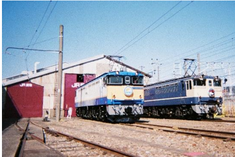
写真 1、展示場所イメージ

DC 線…1091 号機、EL3 番線…1101 号機、EL2 番線…1139 号機