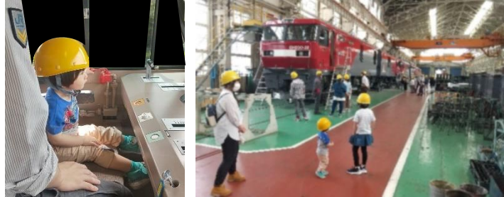
運転台・主棟(施設内)見学イメージ