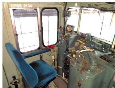
写真 2、2139 号機イメージ