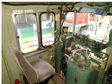
写真 1、2065 号機イメージ