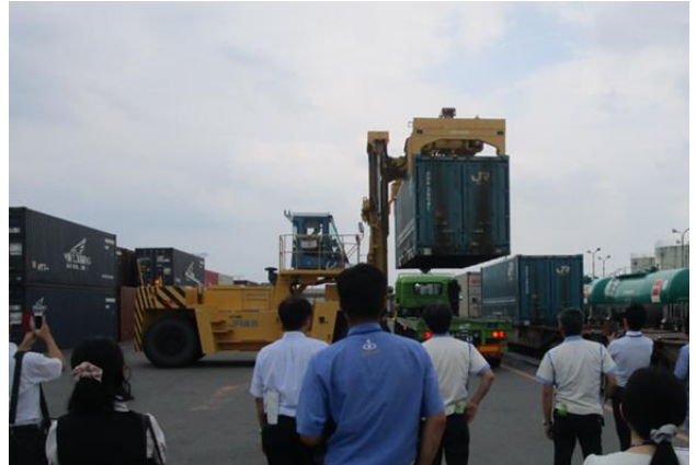
2018年度 鉄道コンテナ見学会の様子(盛岡貨物ターミナル駅)