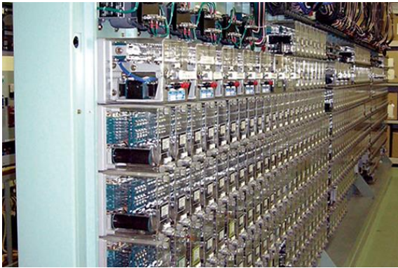
(写真 4) 7