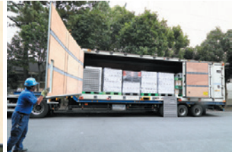
折りたたまれていた扉を閉める

白いコンテナ側面には同社ロゴの他、三菱倉庫グループが提供するCO 2 可視化・削減サービス「MLC Green Action」のロゴがラッピングされている。