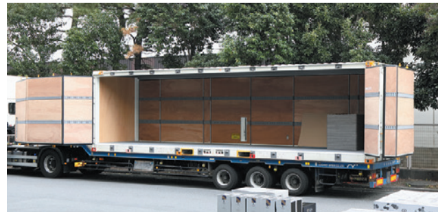
サイド扉が全部開き、荷役しやすいPANORAMA BOX