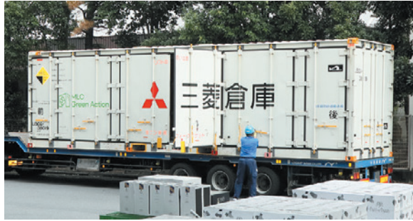
三菱倉庫のロゴ入り31ftコンテナ

環境基準をお持ちです。日本国内の輸送についても、サステナブルで環境負荷の小さい輸送手段として、貨物鉄道輸送の利用比率を上げるよう求められたことが大きなきっかけです。それ以前から、安定した輸送力の確保を念頭に31ftコンテナの利用を考えてはいました。将来的な需要を見越した投資であり社内のコンセンサスを得る必要はありましたが、31ftコンテナを定期的に、自由度をもって利用するためにリースするという判断になりました」と河西さんは振り返る。