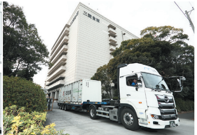
三菱倉庫大井営業所から東京(夕)へ向かう集配トラック