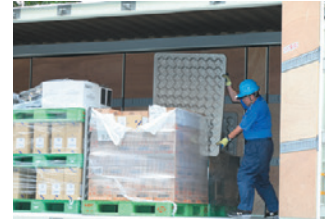
間に養生材を入れる