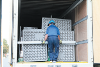
妻側をラッシングバーで固定