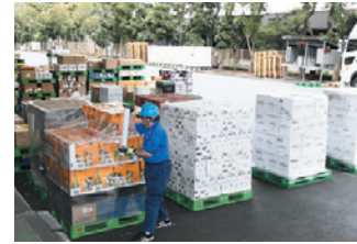
ストレッチフィルムを巻く