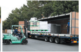
2/パレットずつ積載