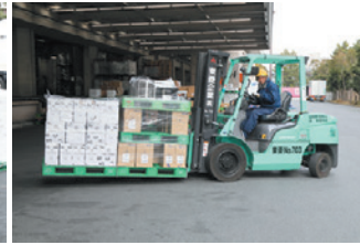
長爪のフォークリフトで