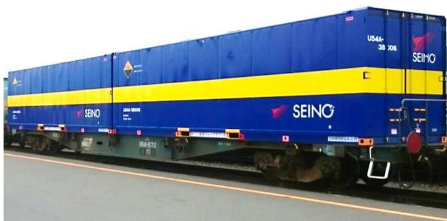
※西濃運輸株式会社 私有 31ft コンテナ