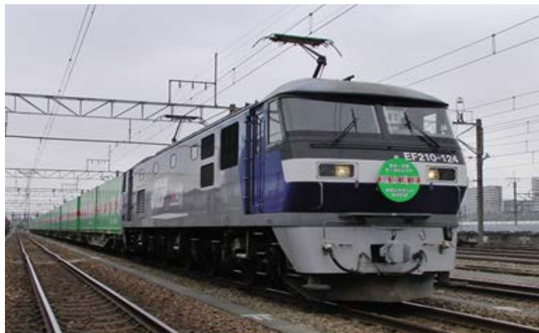
※福山レールエクスプレス号(東京タ～吹田タ間、東京タ～東福山間運行)