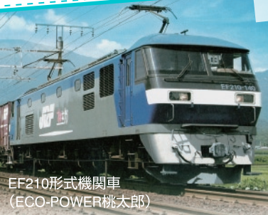
EF210形式機関車 (ECO-POWER桃太郎)