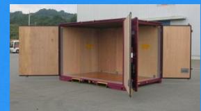
12フィートコンテナ (容積 18m 3 )