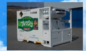
12フィートリーファーコンテナ (温度設定: -25℃~+25℃)