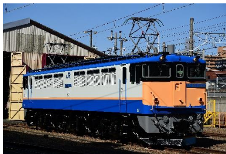
写真 2、EF65 1065 号機デザイン