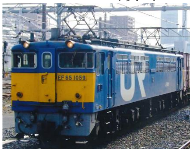
写真 3、EF65 1059 号機デザインイメージ

2024 年 大宮車両所は、日本鉄道株式会社時代の操業開始より 130 周年を迎えたことを記念し、国鉄分割民営化（1987 年）直後に EF65 1065 号機が当時纏った貨物オリジナルの塗粧に復元します。同じく 1987 年に EF65 1059 号機もデザインの異なる貨物オリジナルの塗粧を纏っていたことから、この度他の EF65 形式車両にて EF65 1059 号機の塗粧に復元します。また当車両は機関車番号板の位置に「EF65 1059」をイメージしたナンバープレート（5 月 4 日～5 日の両日取付けます。1065 号機の機関車番号板は、青色のみを予定しております。