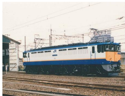
写真 2、EF65 1065 号機イメージ

2024 年、大宮車両所は開所 130 周年を記念し、EF65 1065 号機については、会社発足直後の 1987 年に塗り替えたオリジナル塗装に復元、EF65 1139 号機については 1984 年頃(当時宮原機関区所属)の仕様へ復元いたします。