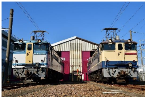
写真 1、撮影イメージ