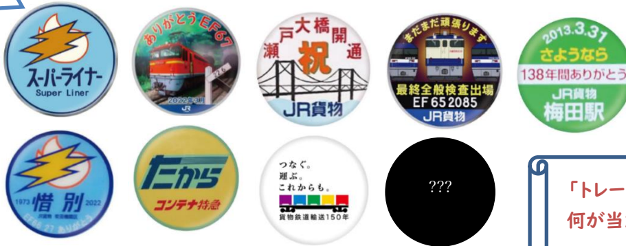
▲JR貨物 ヘッドマーク トレーディング 缶バッジ 400円(税込) ※全9種のうち1個入り (BOX購入で全9種類コンプリート可能)