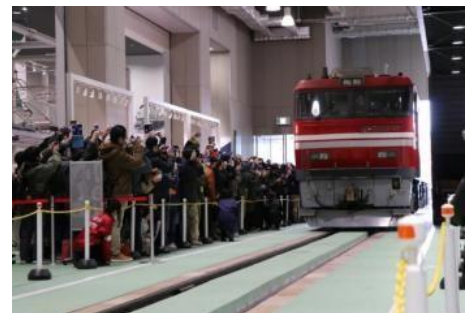
▲過去に開催した様子