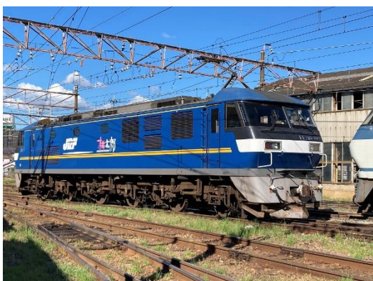
▲EF210形式309号機直流電気機関車

展示期間中は、通常は間近で見ることが出来ない車両を様々な角度からご覧いただけます。また、関連イベントも開催しますので、ぜひこの機会にお越し下さい。