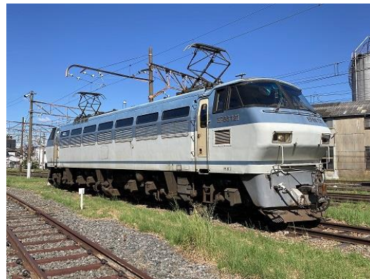
▲EF66形式121号機直流電気機関車