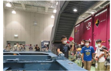
▲過去に開催した様子