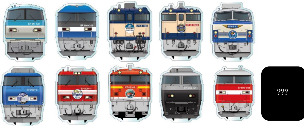
▲JR貨物 トレーディング アクリルマグネット 750円(税込) ※全11種のうち1個入り (BOX購入で全11種類コンプリート可能)