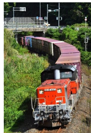
山陰本線を走行する迂回貨物列車