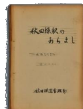
「秋田操駅のあらまし」 (1966年)