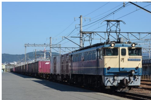
EF65 形式直流電気機関車 (※写真はイメージです。実際に展示する車両とは異なります。)