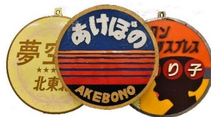
ヘッドマーク (イメージ)

※1~2時間おきに1回程度のペースでヘッドマークを付け替える予定です。 ※天候等、状況によりヘッドマークの装着を中止する場合があります。 ※仮設の柵の外側(E1系新幹線電車側)からご覧いただけます。写真撮影される際は、柵の外側から撮影してください。 ※車両には触れないようお願いいたします。