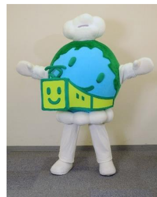
エコレールマークちゃん