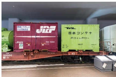
コキ50000形式コンテナ車