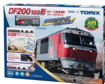
DF200-100形Nゲージ 鉄道模型ファーストセット (イメージ)

トミックス製Nゲージ入門者向けの「DF200-100形Nゲージ鉄道模型ファーストセット」を使って、鉄道模型でコンテナ貨物列車を走らせるワークショップを開催します。レールを組み立て、コンテナ車にコンテナを載せ、ディーゼル機関車をコントロールして走らせるイベントです。