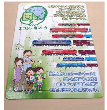
エコレールマークパズルゲーム

※ノベルティグッズは小学生以下のお客さまお一人につき1つお渡しします。 ※ノベルティグッズがなくなり次第、エコレールパズルゲームを終了します。