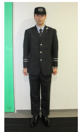
貨物列車運転士の制服 （イメージ）

※JR貨物の現役運転士は16日（土）、17日（日）のみ登場します。 ※JR貨物の現役運転士の登場は、急遽予定が変更になる場合がございます。 ※カメラはお客さまご自身でご用意ください。