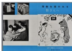
パンフレット「荷物を扱われる皆さんへ」 (1959年)