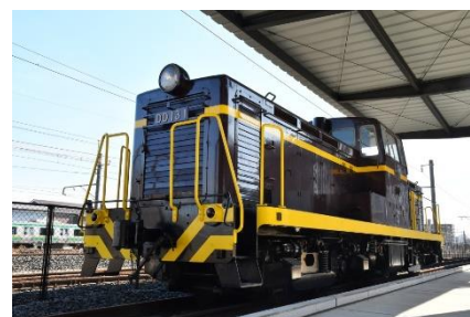
DD13形式ディーゼル機関車