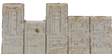
貨物列車運転時刻表 (遠軽機関区・1983年～1985年頃)