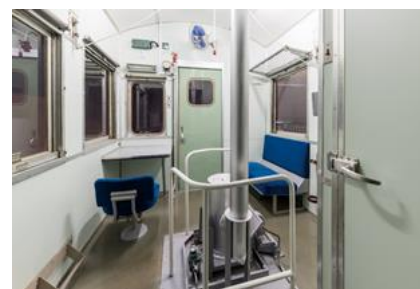
レムフ 10000 形式冷蔵緩急車 車掌室

レムフ 10000 形式冷蔵緩急車の車掌室を特別に公開し、当館ボランティアスタッフによる解説を行います。普段は入ることのできない車掌室に入ることができます。