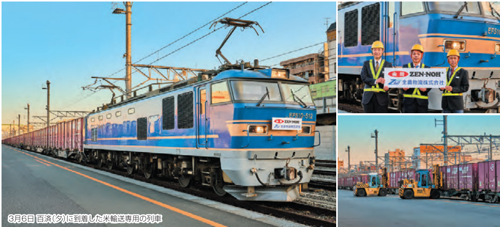
3月6日 百済(夕)に到着した米輸送専用の列車

JA全農(全国農業協同組合連合会)・全農物流(株)とJR貨物は、米を東北・新潟・北陸の産地から西日本の消費地へ列車を貸し切りで運ぶ実証実験を行った。2月19日と3月5日、通常日曜日は運休する第4077~4076列車(八戸貨物一戸済(夕)間)を復活運転し、八戸貨物・東青森・秋田貨物・新潟(夕)・金沢(夕)で12ftコンテナを順次積載し、1回目は合計97個、2回目は100個を輸送した。発側の各駅には古川ORS・水沢駅・富山貨物駅はじめ近隣の貨物駅からも12ftコンテナで送り込み、着側の百済(夕)からは関西・中国・東海・九州地区の駅へと鉄道輸送された。ビール飲料など複数メーカーによる列車の貸し切りはあるが、貨物を米に絞ったケースは初めて。