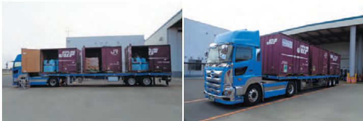
12ftコンテナにフレコンと紙袋を積載

国内で生産される米(ご飯として食べる主食用米)の3割に当たる約200万tが、産地の農協や全農県本部を通して集め