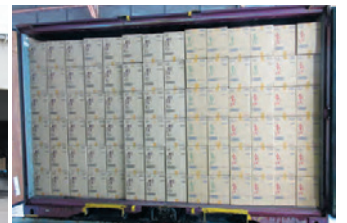
12ftコンテナに積み込まれた製品

需要のピークに備え、11月頃から計画的に連日上限の6個を送り込み在庫水準を上げ、お客さまにご迷惑をお掛けしないようにしています」と話す。