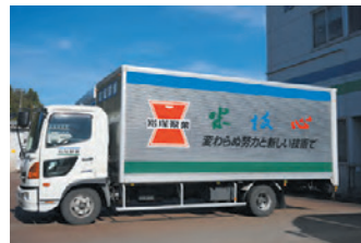
市内の仕込み工場から焼き工場へ生地を運ぶ岩塚製菓のトラック