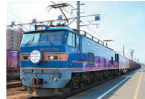
新潟(夕)を出発するお菓子専用列車

こうした取り組みを含め、昨年1~12月の鉄道利用実績は、福岡向けで12ftコンテナ1,349個、岡山向け1,333個、広島向け60個に上る。近年、四国・九州での売り上げが好調なことにより、年々増加傾向だという。