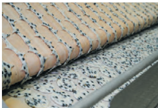
黒豆せんべいの製造ライン