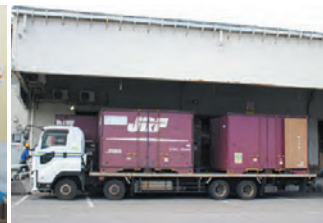
日本通運の集配トラック